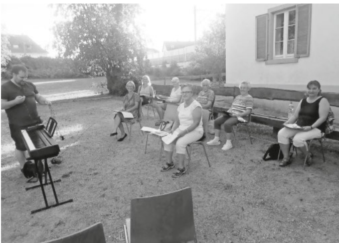
1. Chorprobe mit dem Sopran